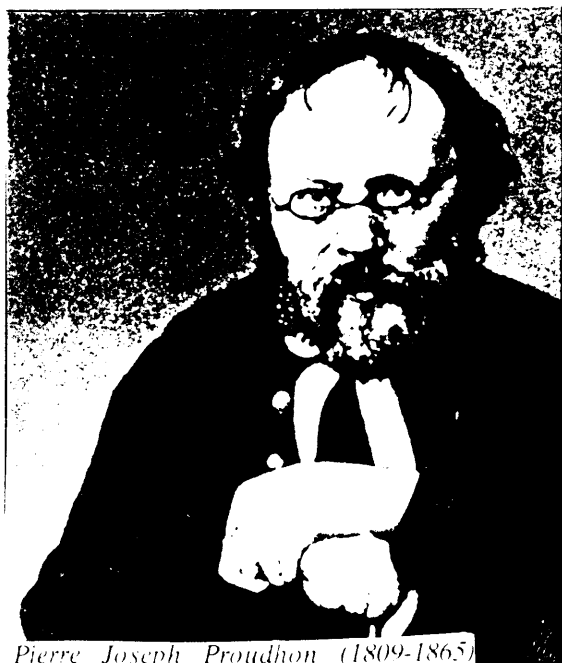
Pierre Joseph Proudhon (1809-1865)

después de Hegel señaló una época, ya que realzó algunos puntos desagradables para la conciencia cristiana e importantes para el progreso de la crítica y que Hegel había dejado en una mística penumbra.