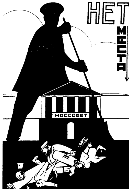
Cartel revolucionario alusivo a la limpieza de las clases dominantes por parte del proletariado

En segundo lugar, la Tesis de Reconstitución trata sobre las condiciones políticas concretas que sirven de contexto a esos requisitos y en cuyo entorno deben ser realizados. Esto significa que la formulación de la Tesis de Reconstitución no se refiere a los principios universales y absolutos del marxismo-leninismo acerca del Partido, sino que, partiendo de ellos trata de aplicarlos a las condiciones históricas y políticas concretas de un país y de una época. Por eso, la Tesis de Reconstitución debe explorar, en primera instancia, el estado actual de la Revolución Proletaria Mundial y la etapa de la Revolución en la que se encuentra ese país como compo-